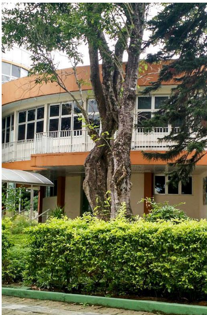
Reitoria UNEB, Campus I.