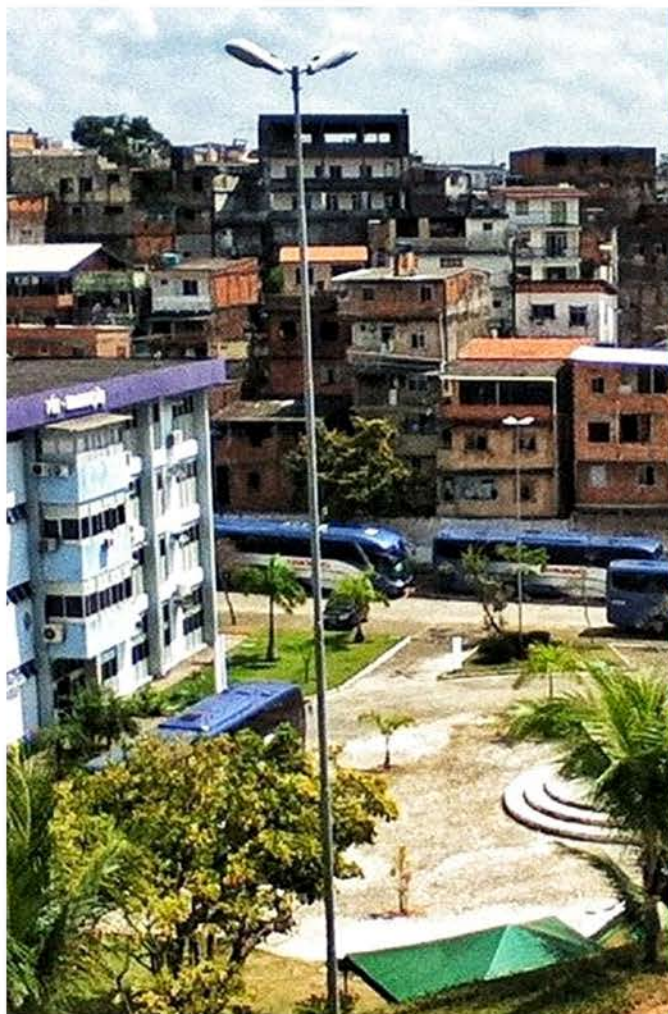
Prédio de Pós-Graduação, Campus 1 - 2012